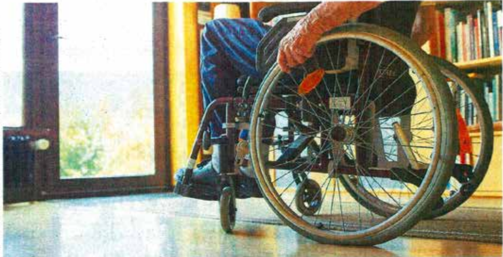
Auch im Alter oder mit einer Behinderung möchten die meisten Menschen gern in ihrem Zuhause wohnen bleiben.

334 neue Fälle übernahmen allein im vergangenen Jahr die vier Beraterinnen, die sich insgesamt 2,7 Vollzeitstellen teilen. „Zunehmend komplex“ werde die Aufgabenstellung, sagte bei der Vorstellung des Jahresberichts 2019 der Awo-Geschäftsführer Franz-Josef Windisch. Viele technische Neuerungen seien zu berücksichtigen, immer neue Regeln für die Gewährung von Zuschüssen gebe es. „Sehr zeitaufwendig“ gestalte sich da